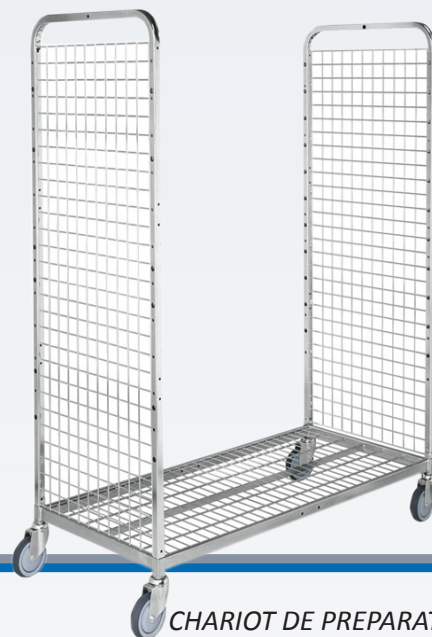
CHARIOT DE PREPARATION DE COMMANDE sans option