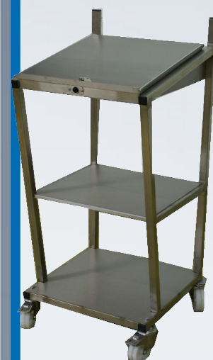
Pupitre acero inoxidable con ruedas + compartimento

Disponible en versión ACERO o dimensiones a medida