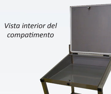
Vista interior del compartimento