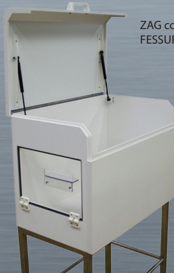
ZAG con Opzione FESSURA + GUIDA