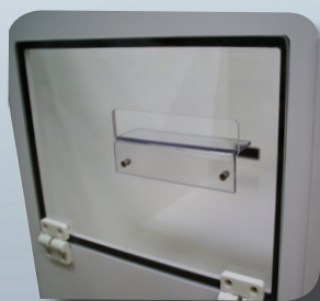
Uscita FESSURA + GUIDA