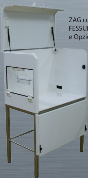
ZAG con Opzione FESSURA + GUIDA e Opzione KDL